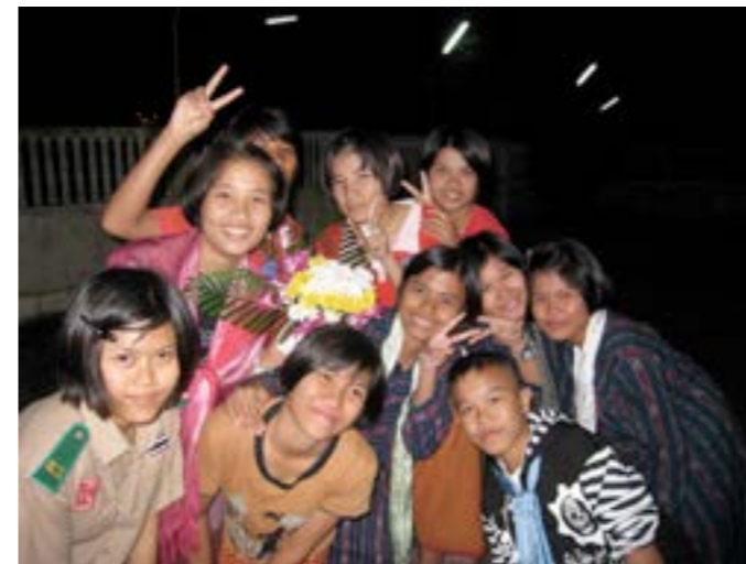
Noen av de som bor på Immanuel internat